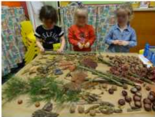
PROMETHEE, MILEY et LUCIE