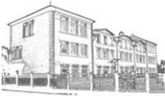
École du Vieux Moulin

Catégories : documents à télécharger Romain Rolland , documents à télécharger Vieux Moulin