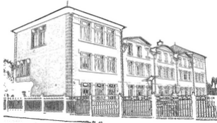
École du Vieux Moulin 03 86 60 92 06