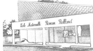
École Romain Rolland 03 86 58 88 97