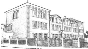
École du Vieux Moulin 03 86 60 92 06